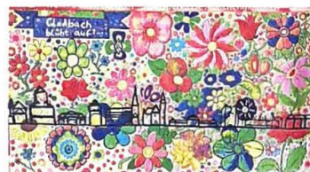
Den zweiten Platz bei den Klassen 5-7 belegt das Förderzentrum Nord mit den Klassen 5/6.