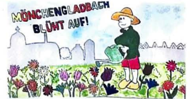
Der vierte Platz in der Kategorie Klasse 8-10 geht an das Förderzentrum Nord mit Klasse 10b.