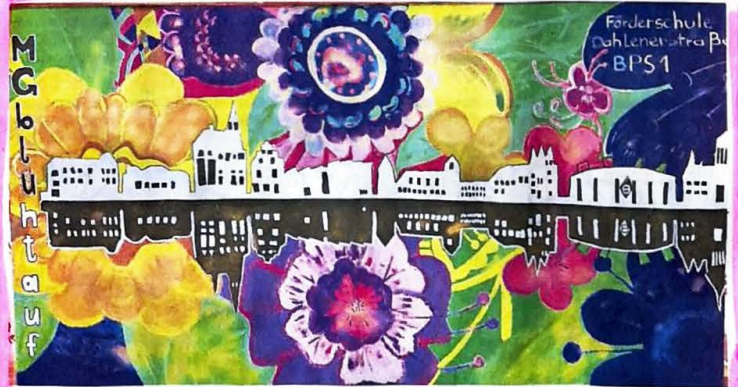
Der erste Platz in der Kategorie Klasse 8-10 geht an die Förderschule Dahlemer Straße mit der Klasse BPS 1. Die Schüler haben ein blumiges Bild gemalt, das sich in der Mitte spiegelt.