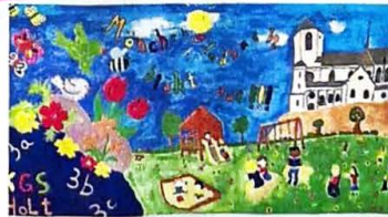
Den zweiten Platz bei den Grundschulen belegt die Katholische Grundschule Holt mit den Klassen 3a, b, c.