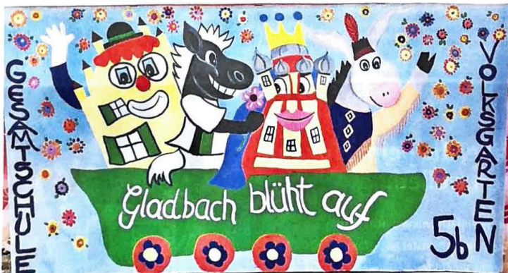
Sieger in der Kategorie Klasse 5-7 ist die Gesamtschule Volksgarten mit der Klasse 5b. Die Wahrzeichen von Rheydt und Gladbach feiern mit Fohlen Jünter und Sparkassenmaskottchen Goldi.