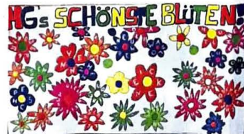
Platz zwei in der Kategorie Klasse 8-10 geht an das Förderzentrum Nord mit der Klasse P1.