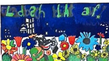
Den dritten Platz in der Kategorie Klasse 5-7 belegt das Förderzentrum Süd mit der Klasse LG5-7.