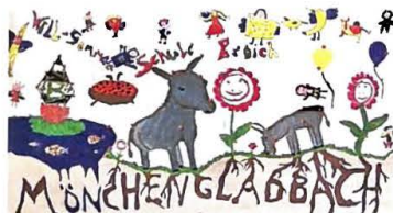
Den dritten Platz bei den Grundschulen belegt die Will-Sommer-Grundschule mit den Klassen 1c, 2c, 3c, 4c.