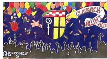
Der dritte Platz bei den Klassen 8-10 belegt die Gemeinschaftshauptschule Kirschhecke mit Klasse 9a.