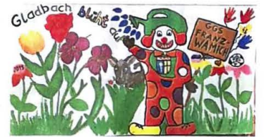
Der vierte Platz bei den Grundschulen geht an die Gemeinschaftsgrundschule Franz Wamich mit der Klasse 4.